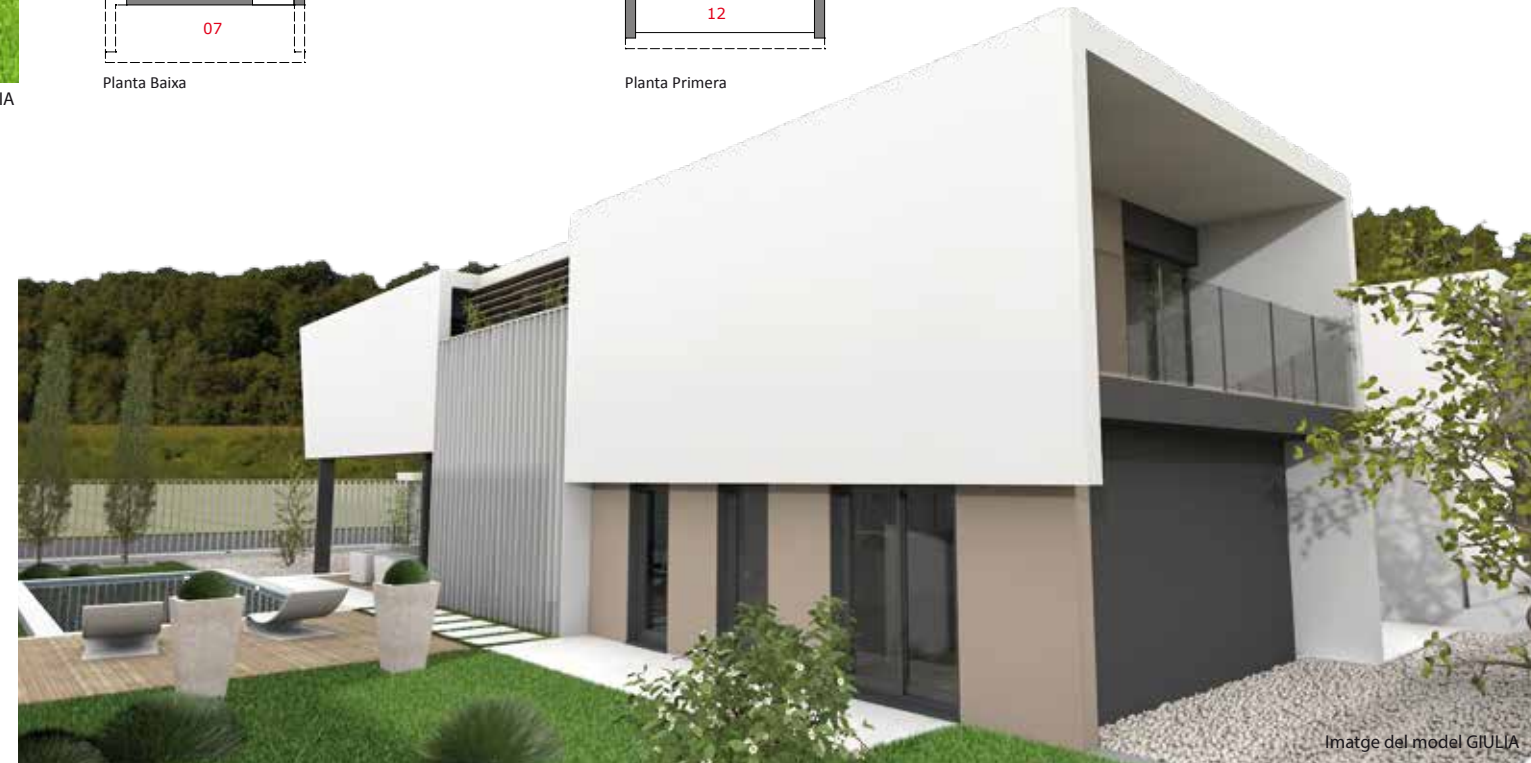
Imatge del model GIULIA

La imatge exterior es pot personalitzar a mida de les necessitats o gustos del client.